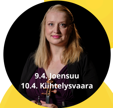
9.4. Joensuu 10.4. Kiihtelysvaara